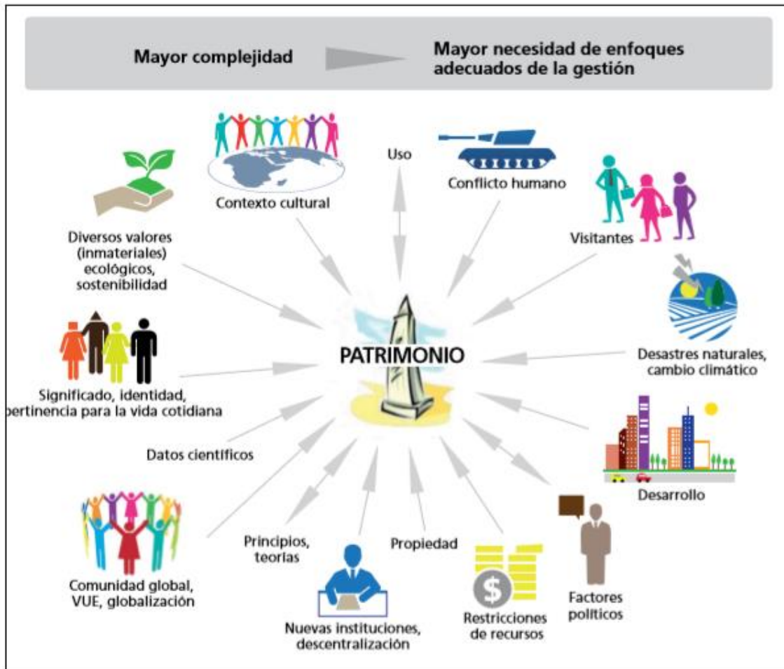
Diagrama 2: Algunos ejemplos de cuestiones viejas y nuevas de la gestión del patrimonio