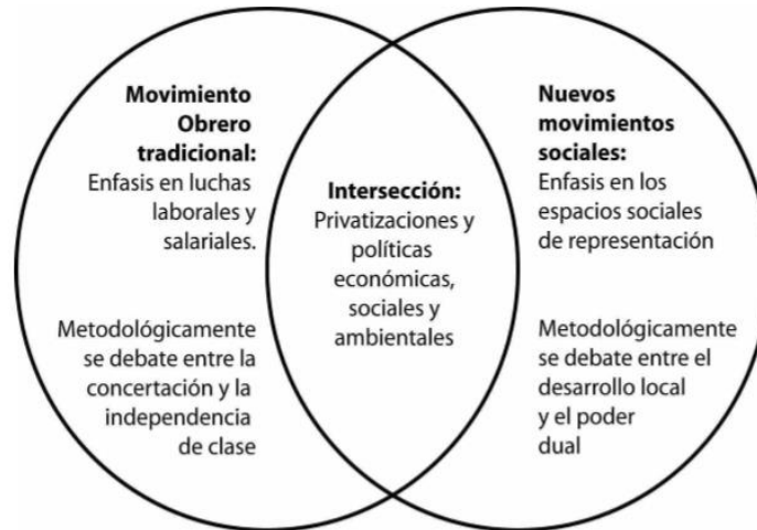
Diagrama de las luchas sociales en América Latina en el contexto de los albores del siglo XXI

Al medio del diagrama dibujado puede establecerse un área de intersección. Esto es, un área donde se manifiesta cierta confluencia de hecho de los “viejos” y los “nuevos” movimientos sociales. Evidenciándose en este sentido, que son las luchas que tienen que ver con las privatizaciones y las políticas generales que intentan concretar el modelo social que le interesa al neoliberalismo (planes de ajuste, políticas fiscales generales, dolarización, etc.), las que concitan una tendencia hacia la participación unificada.